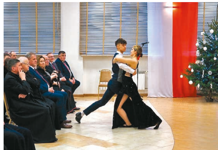
Efektowne tango w wykonaniu pary tanecznej z Zespołu Pieśni i Tańca „Podlaskie Kukułki”