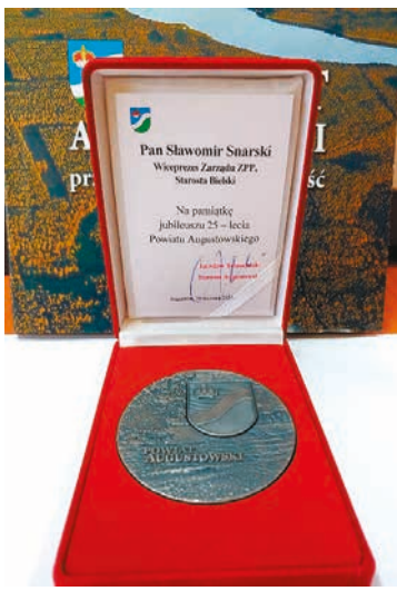
Medale otrzymane przez starostę Snarskiego