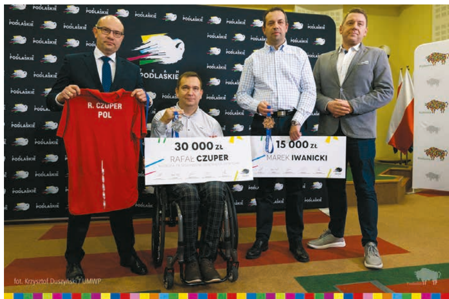
Nagroda marszałka województwa dla najlepszego sportowca z niepełnosprawnościami